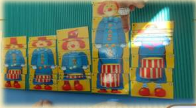
日本の伝統的なおもちゃです江戸時代からあるものもあります。